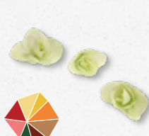
Floremano® Origan, saveur estivale