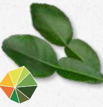
Kaffir Lime Leaves Agrume sucré, citron vert