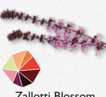
Zallotti Blossom Menthe, basilic