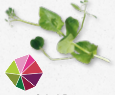
Salad Pea Goût subtil de pois