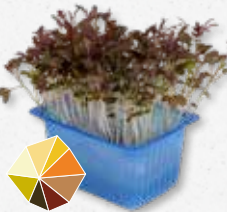
Kyona Mustard Cress