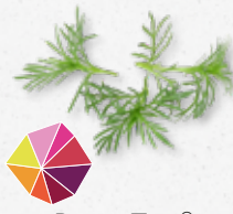
Pazzizz Tops® Sucré, anis