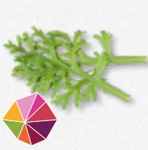
Kikuna® Leaves Carotte, céleri