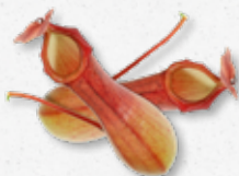
Venus Vase Non comestible