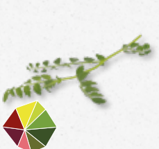
Hummus Leaves Pois chiche