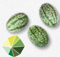
Pepquiño® Frais, concombre légèrement acide 1)