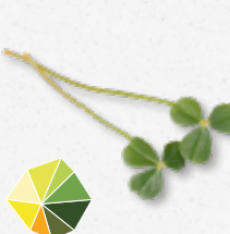
Citra Leaves® Agrume acides frais