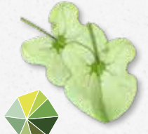
Syrha Leaves® Acide, frais