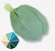
Oyster Leaves Saumâtre, huître