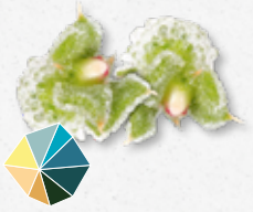
BlinQ Blossom® Frais, saumâtre, salé