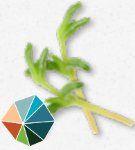
Salty Fingers® Saumâtre, croquant, légèrement amer