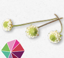
Dushi® Buttons Sucré, menthe, thym, plus sucré que le sucre