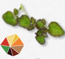
Hippo Tops Relevé cresson de fontaine