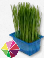
Wheat Grass Très sucré 5)