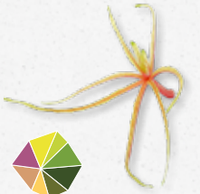
Aikiba® Leaves Gelée, légèrement aigre-douce