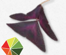
Yka Leaves® Acide, légèrement sucrée