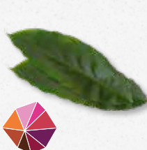
Cardamom Leaves Cannelle, boisée, légèrement sucré