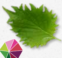
Shiso Leaves Green Menthe, anis