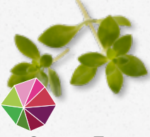
Gangnam Tops Frais, légèrement amer