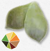
Majji® Leaves Feuille juteuse et croquante