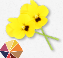
Cornabria Blossom® Savueur printanière rafraîchissante