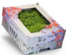
Dulce Mix 2)