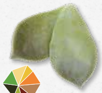
Majji® Leaves Sappig en knapperig blad