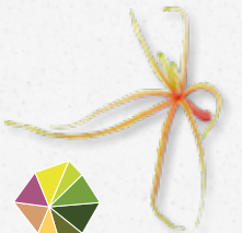
Aikiba® Leaves Gel-achtig, licht zoet-zuur