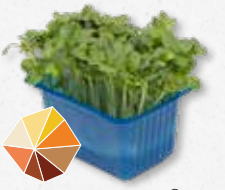
Daikon Cress® Rettich, rammenas