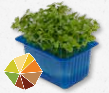
RucolaCress® Noten (1)