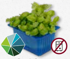
Basil Cress Basilicum