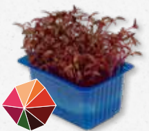
Scarlet Cress Milde rode biet