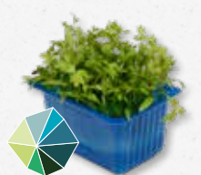
Motti Cress Aromatisch, selderij, maggiplant (lavas)