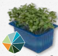
BroccoCress® Rauwe broccoli