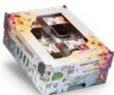
Shiso Leaves Mix 2)

Een speciale mix van de nieuwste cressen.