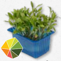
Ghoa Cress® Citrus, milde koriander