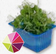
Affilla Cress® Verse doperwten