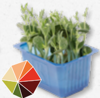
Lupine Cress Stevige bite, licht bitter; frisse bonen, knapperig (3)