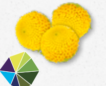
Sechuan Buttons® Tintelend, elektrisch, verdovend