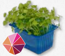
Atsina® Cress Zoete anijs, zoethout