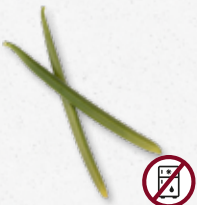
Planifolia Green-Vanilla Vanille (smaak naar eigen invulling) 6)