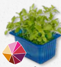
Hony® Cress Honingzoet