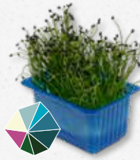
Rock Chives® Milde knoflook