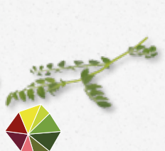
Hummus Leaves Kikkererwten