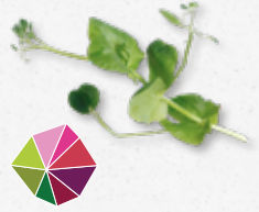
Salad Pea Subtiële erwtenmaak