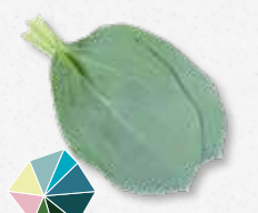
Oyster Leaves Ziltig, oester