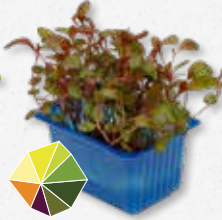
Adji Cress Zwarte peper