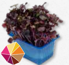
Sakura® Cress Radijs, rammenas