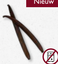
Planifolia Black-Vanilla Leer, specerij, noten, aards, hout 6)