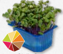
Chilli Cress Scherpe mosterd