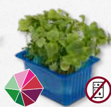
Shiso Green Munt, anijs