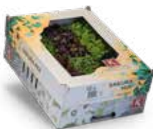
Sakura® Mix 2)