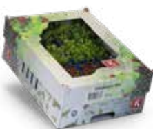
WhatZnew Mix 2)

Een speciale mix van de nieuwste cressen.