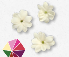
Jasmine Blossom Aromatisch, jasmijn