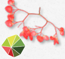
Apple Blossom Friszuur, groene appel