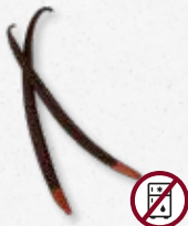
Planifolia Red-Vanilla Bloemig, fris, rood fruit, butterscotch 6)