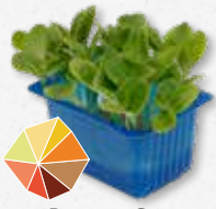
Borage Cress Zilt, oester, komkommer