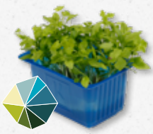
Persinette® Cress Peterselie