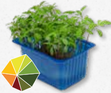
Acla Cress® Fris, munt, citrus