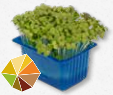
Mustard Cress Mierikwortel, wasabi (1)