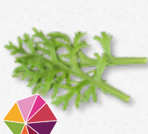
Kikuna® Leaves Wortel, selderij