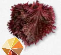
Shiso Leaves Purple Komijn