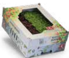
Shiso Mixed 2)