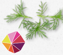
Pazzizz Tops® Zoet, anijs