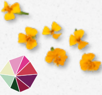
Anise Blossom Anijs, dragon