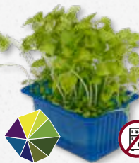
Sechuan Cress® Tintelend, elektrisch, verdoevend