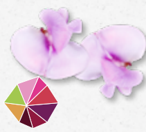
Bean Blossom Frisse bonen