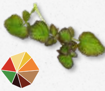
Hippo Tops Pittige waterkers