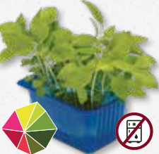
Limon Cress Limoen, anijs