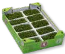
Tuinkers (10x) Mosterd, pittig, radijs