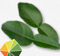
Kaffir Lime Leaves Zoete citrus, limoen