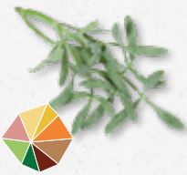
Sea Fennel Aromatisch, kruidig, asperge