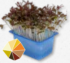
Kyona Mustard Cress Milde mosterd (1)