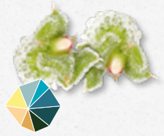
BlinQ Blossom® Fris, ziltig, zout