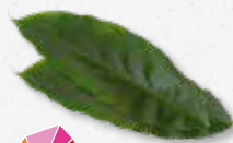
Cardamom Leaves Cynamonowy, drzewny, lekko słodki