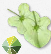
Syrha Leaves® Odświeżający kwaśny