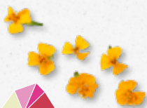
Anise Blossom Anyż, estragon