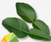
Kaffir Lime Leaves Słodki cytrusowy, limonka