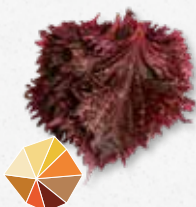
Shiso Leaves Purple Kumin