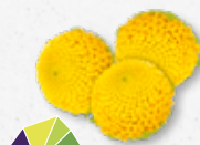
Sechuan Buttons® Mrowienie, elektryzujący, paraliżujące