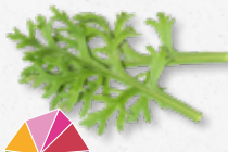
Kikuna® Leaves Marchew, seler