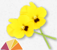
Cornabria Blossom® Świeży aromat wiosny