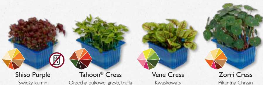
Shiso Purple Świeży kumin