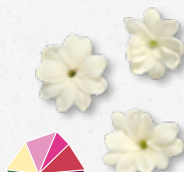
Jasmine Blossom Aromatyczny, jaśminu