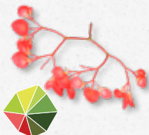
Apple Blossom Smak kwaśny, zielone jabłko