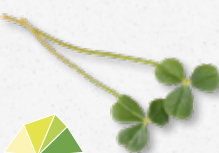
Citra Leaves® Odświeżający, kwaskowe nuty cytrusowe