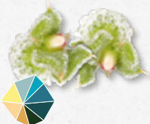
BlinQ Blossom® Swieży, solanka, sól