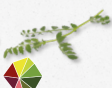
Hummus Leaves Groch włoski