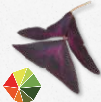
Yka Leaves® Kwaśny z lekko słodkim posmakiem