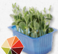
Lupine Cress (3)

Textura dura, ligeiramente amargo, feijões frescos, crocante