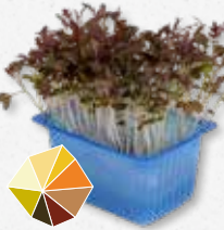
Kyona Mustard Cress