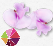
Bean Blossom Feijão verde