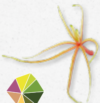
Aikiba® Leaves Gelatinoso, ligeiramente agridoce