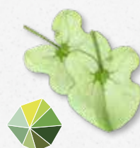
Syrha Leaves® Ácido fresco