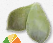
Majji® Leaves Folhas suculentas e crocantes