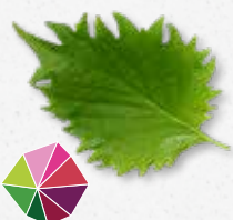
Shiso Leaves Green Menta, anís