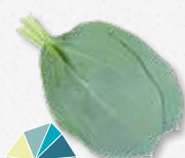
Oyster Leaves Marinho, ostras