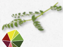
Hummus Leaves Grão de bico